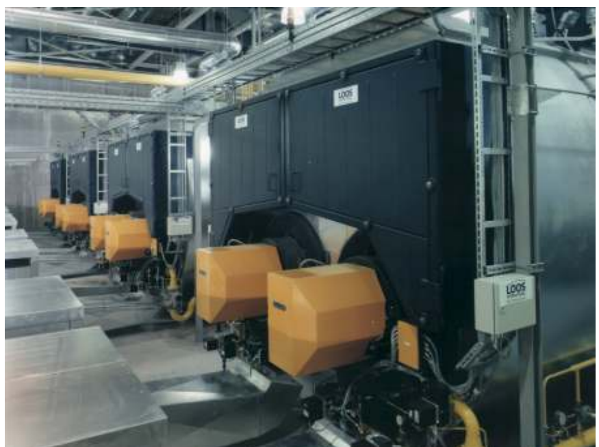
четыре двухжаротрубных газотрубных котла UNIVERSAL ZFR с паропроизводительностью 120 т/ч на бумажной фабрике

Бумагоделательные машины самого последнего поколения предназначены для производства бумажного полотна шириной до 10 м со скоростью до 2000 м в минуту и могут продемонстрировать все свои возможности только вместе с соответствующими котельными