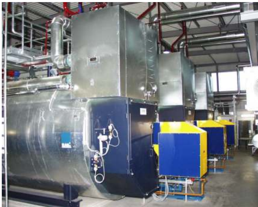
Пример применения на бумажной фабрике - 3 паровых котла с пароперегревателем.

Компания LOOS INTERNATIONAL всегда разрабатывает наиболее оптимальную концепцию для любой сферы применения независимо от того, идёт ли речь о модернизации или расширении сети паро- и теплоснабжения. LOOS INTERNATIONAL владеет «ноу-хау», основанным на эксплуатации многочисленных котлов, уже десятилетия успешно работающих во многих странах мира. Надёжные котельные системы LOOS, оборудованные самой современной техникой автоматического регулирования и управления, отвечают специфическим требованиям наиболее современных и крупных бумажных фабрик с потреблением пара 200 т/ч и выше. Знак соответствия CE и сертификаты большинства организаций государственного надзора облегчают получение допуска к эксплуатации в мировом масштабе. Компания LOOS INTERNATIONAL является компетентным партнёром бумажной промышленности